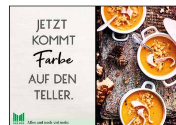
K2 | Kassentisch | wall-2x1 | A2