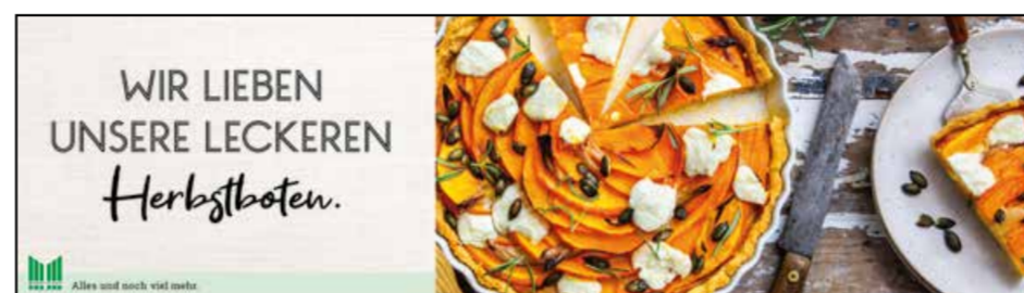
OG3 | Obst & Gemüse | wall-Sonderformat