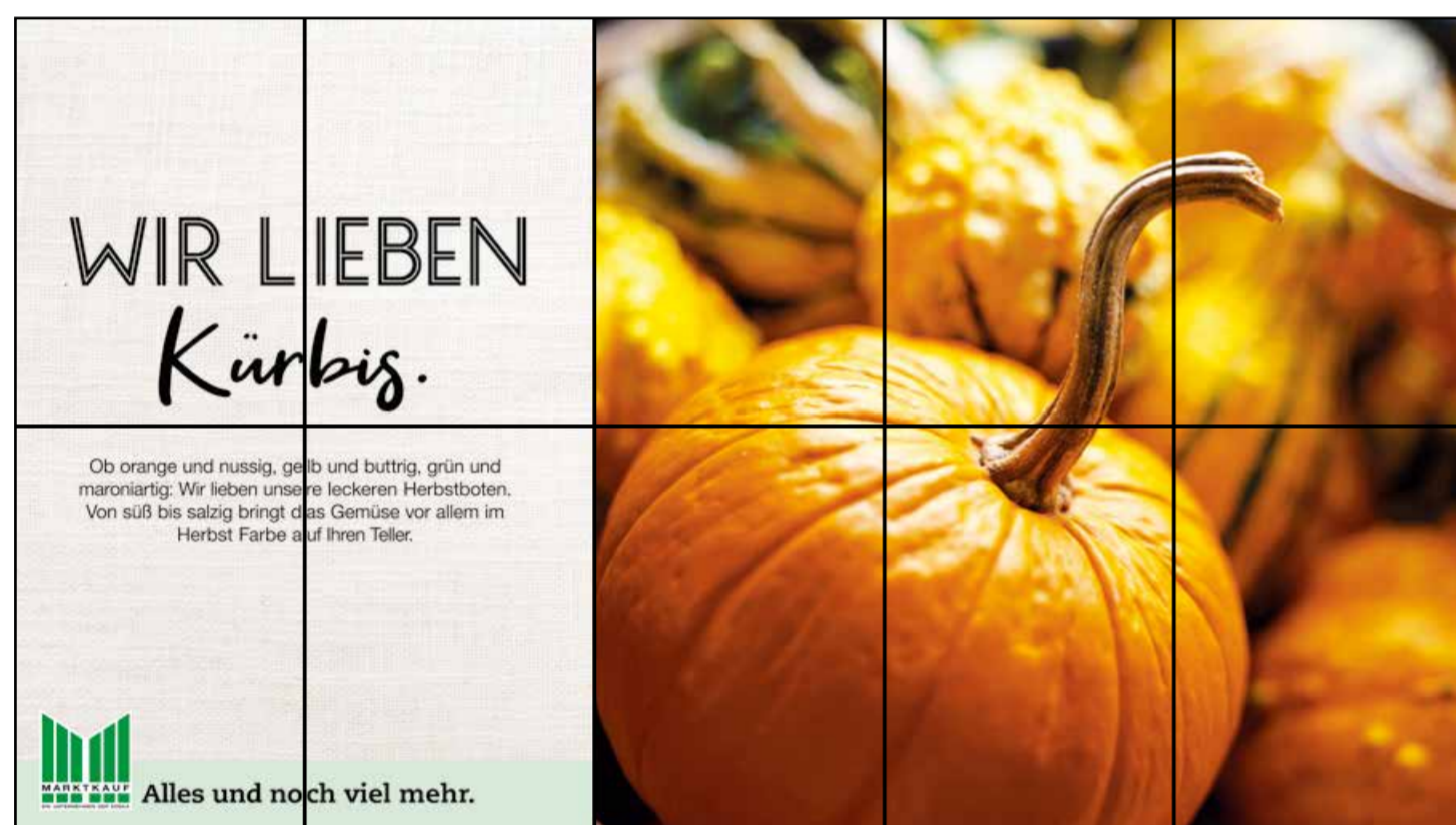
E1 | Eingang | wall-5x2 | A2/A3