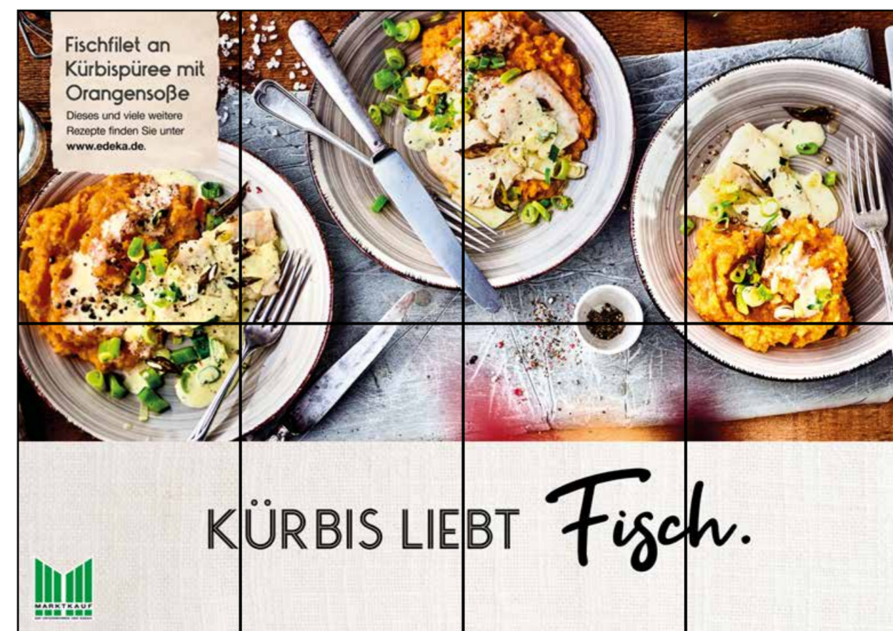
F7 | Frischetheke | wall-4x2 | A2/A3