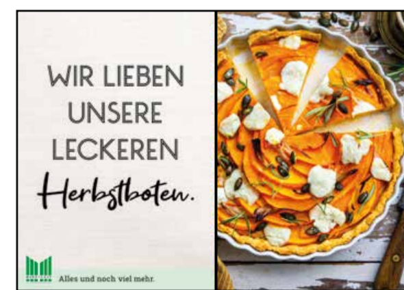
K3 | Kassentisch | wall-2x2 | A3