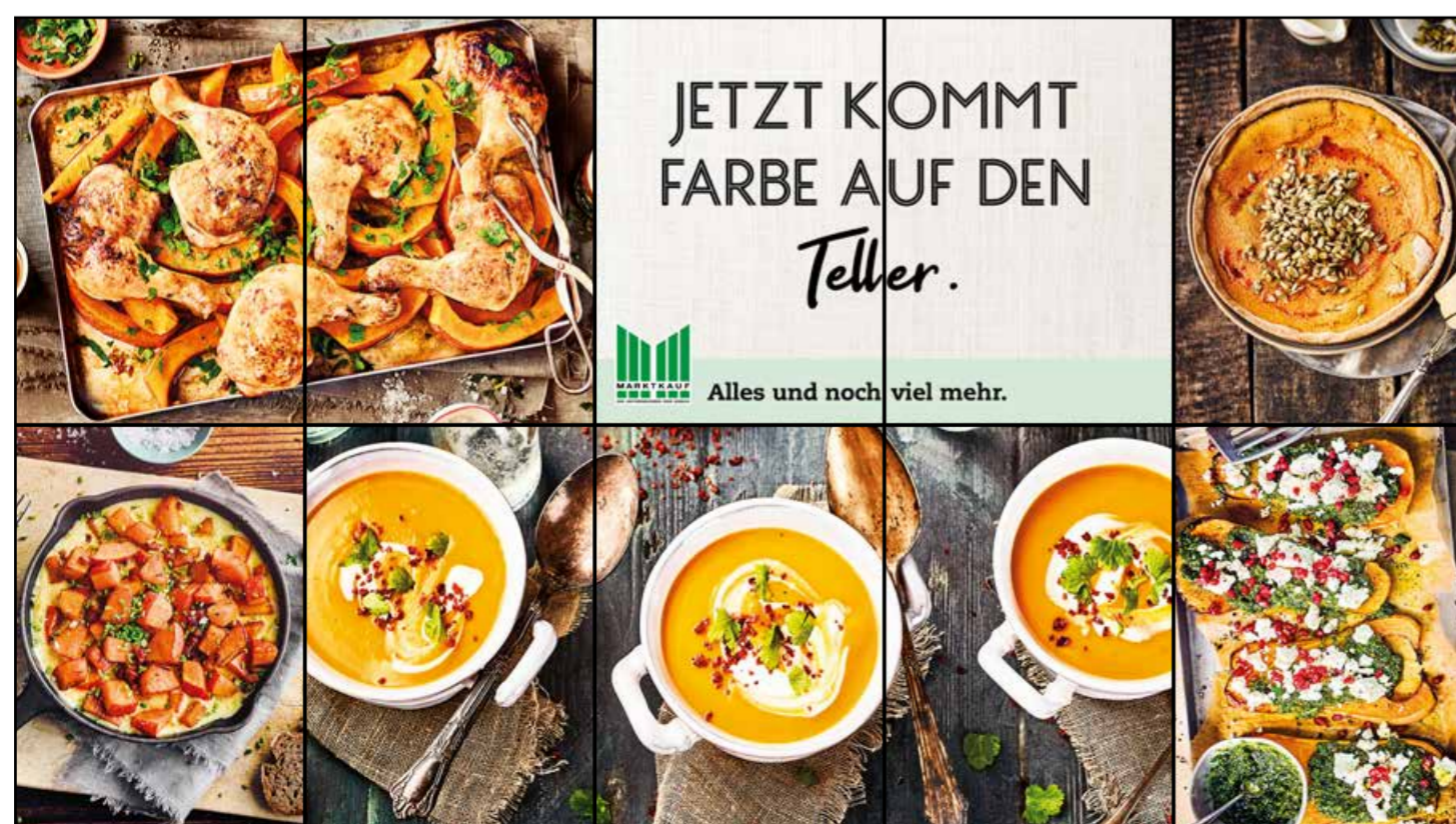
E2 | Eingang | wall-5x2 | A2/A3