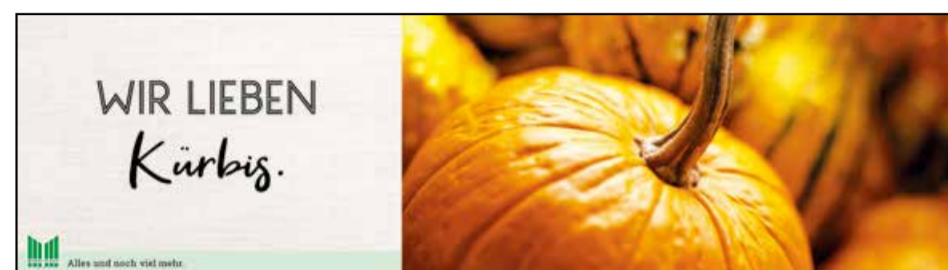
OG1 | Obst & Gemüse | wall-Sonderformat