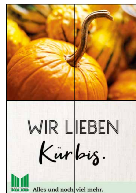
E5 | Eingang | wall-2x2 | A2