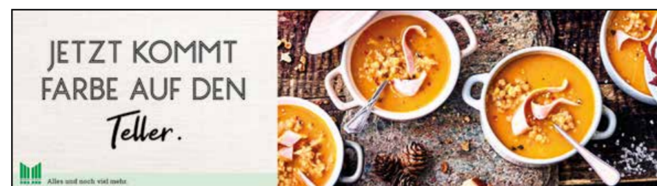
OG2 | Obst & Gemüse | wall-Sonderformat