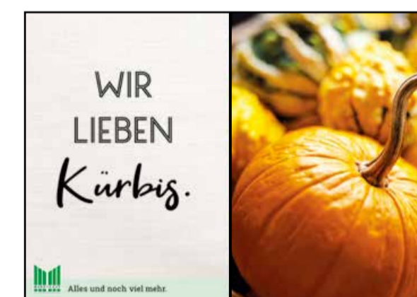
K1 | Kassentisch | wall-2x1 | A2