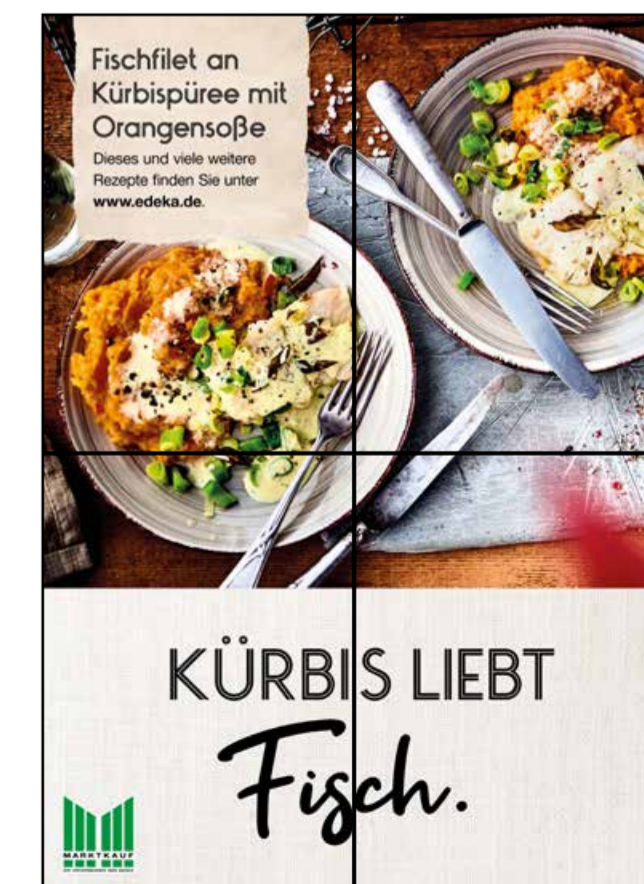
F8 | Frischetheke | wall-2x2 | A2/A3