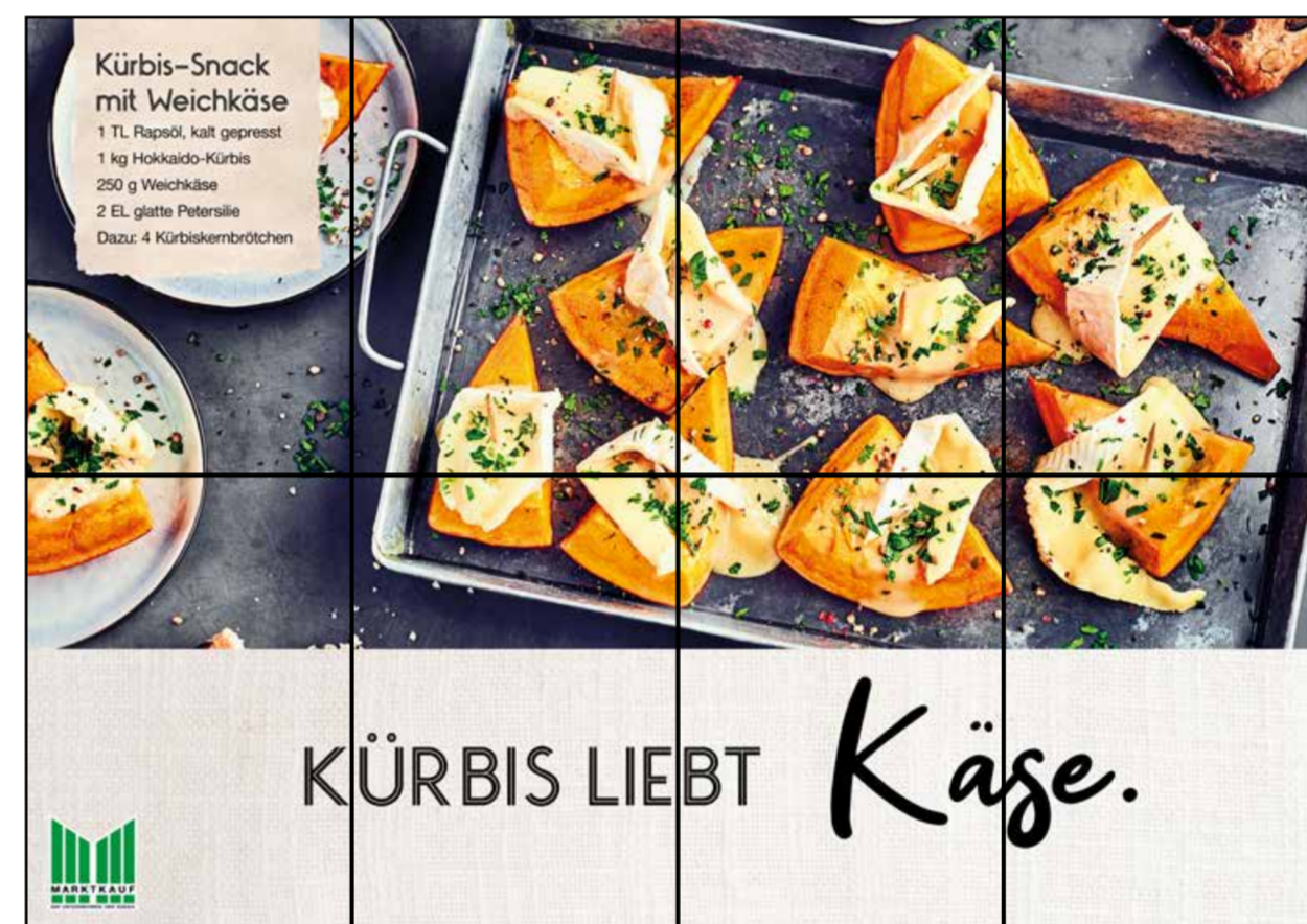
F5 | Frischetheke | wall-4x2 | A2/A3