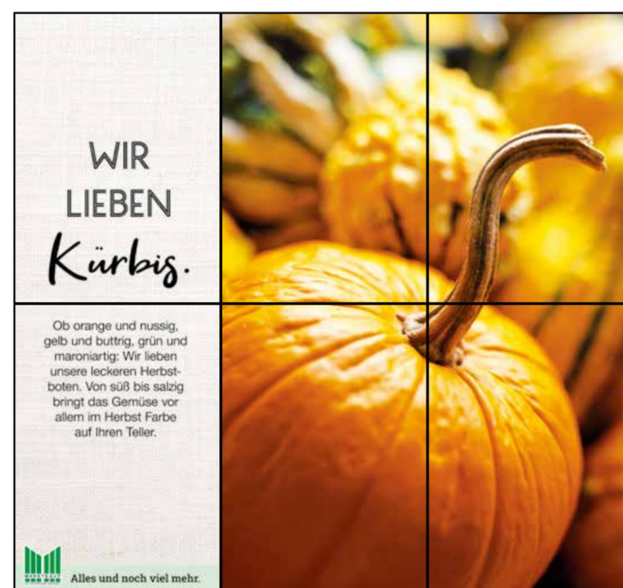
E3 | Eingang | wall-3x2 | A2