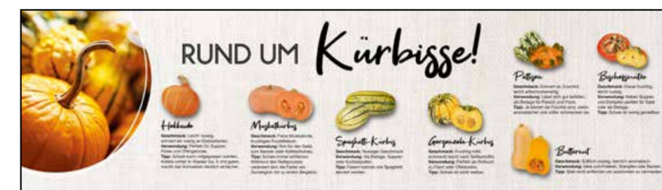
OG4 | Obst & Gemüse | wall-Sonderformat