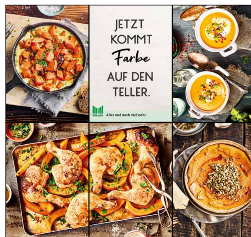
E4 | Eingang | wall-3x2 | A2