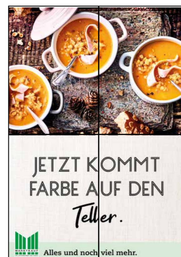
E6 | Eingang | wall-2x2 | A2