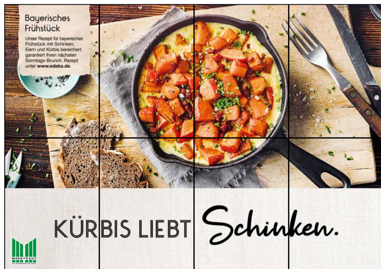
F3 | Frischetheke | wall-4x2 | A2/A3