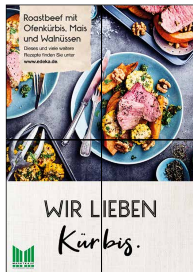
F2 | Frischetheke | wall-2x2 | A2/A3