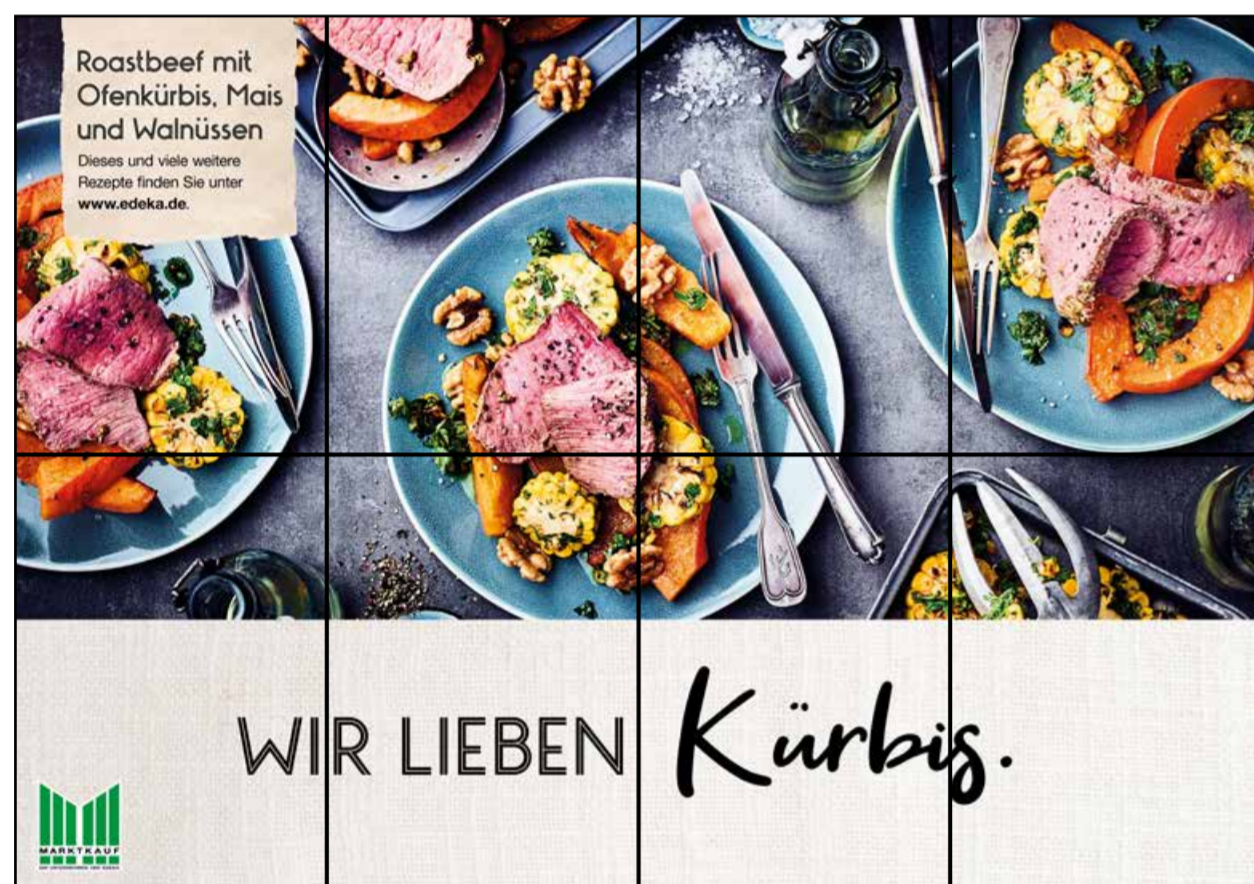
F1 | Frischetheke | wall-4x2 | A2/A3