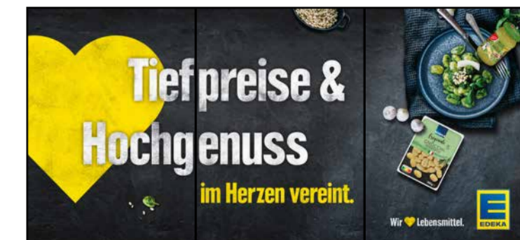
B4 | BakeOff | wall-4x1 | A3