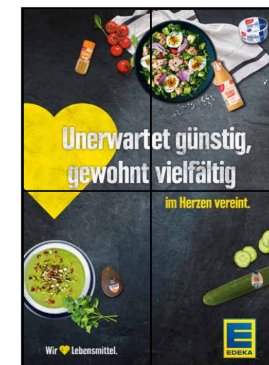
E12 | Eingang | wall-2x2 | A2