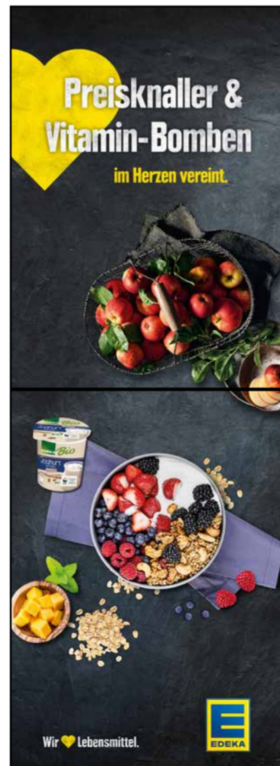
S12 | Stele-1x2 | A2