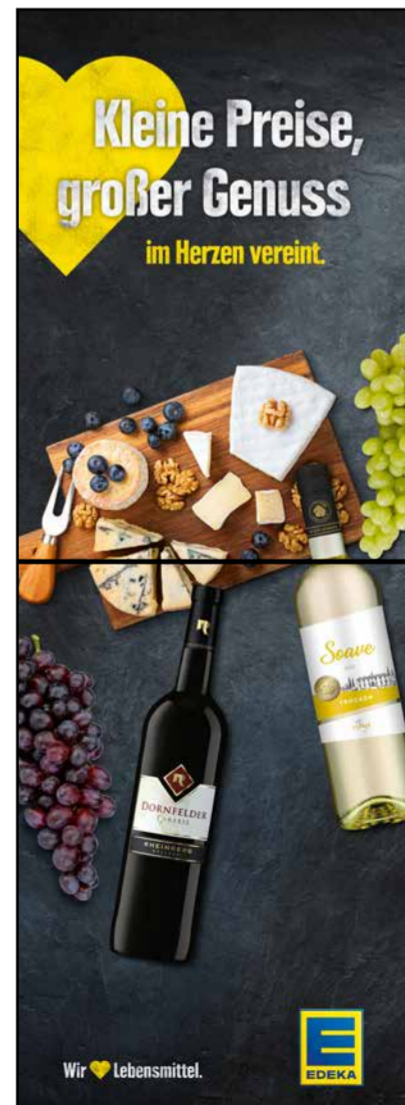
S16 | Stele-1x2 | A2