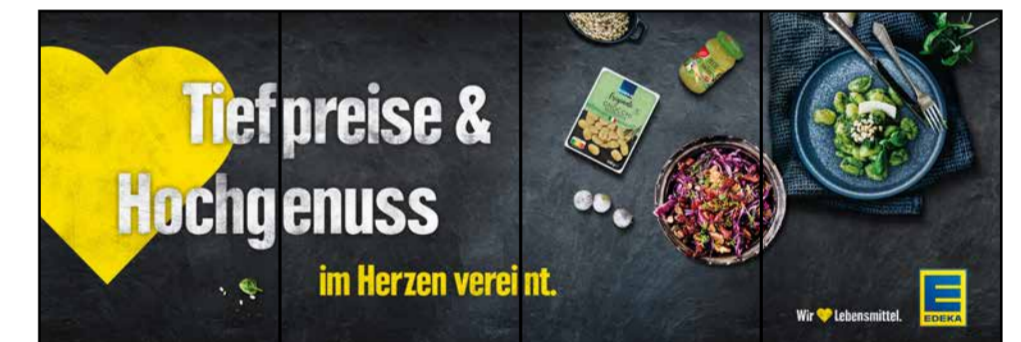
B7 | BakeOff | wall-4x1 | A3