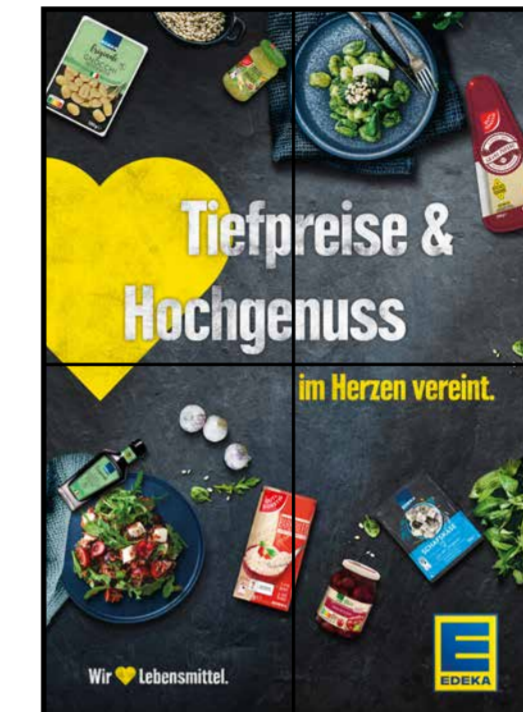
E10 | Eingang | wall-2x2 | A2