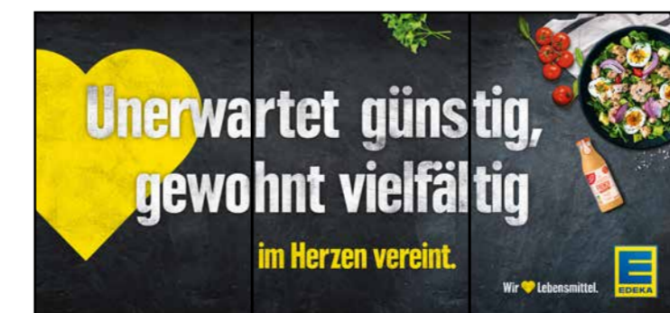
B6 | BakeOff | wall-4x1 | A3