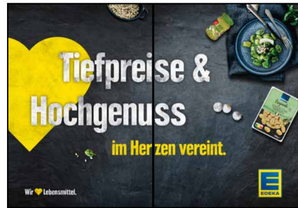
K1 | Kassentisch | wall-2x1 | A2