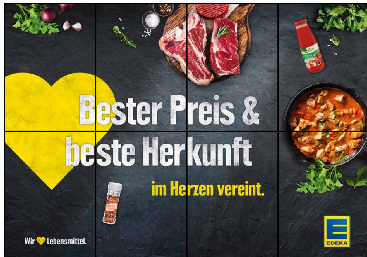
F3 | Frischetheke | wall-4x2 | A2/A3