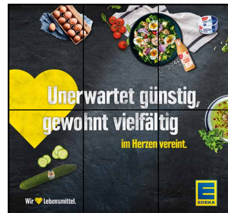
E6 | Eingang | wall-3x2 | A2