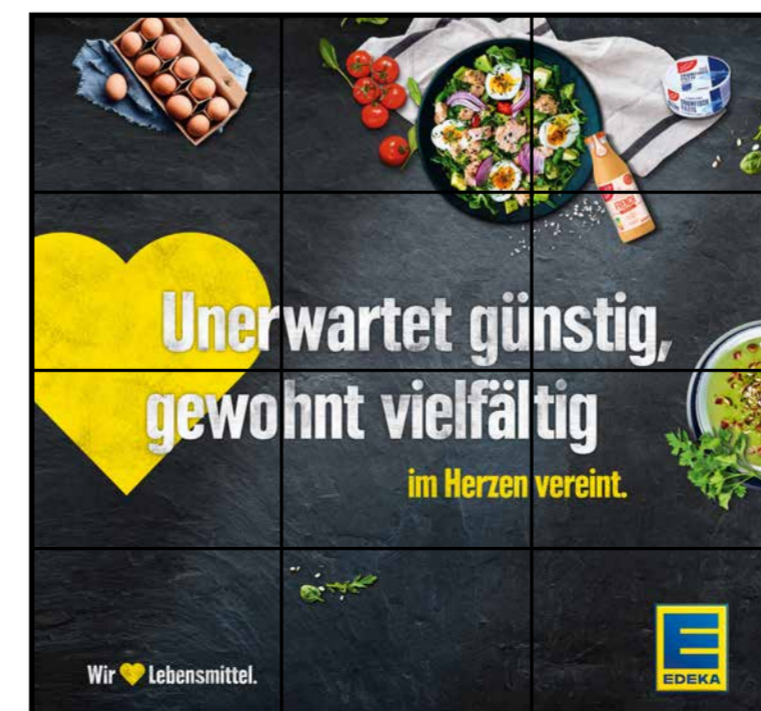
E9 | Eingang | wall-3x4 | A3