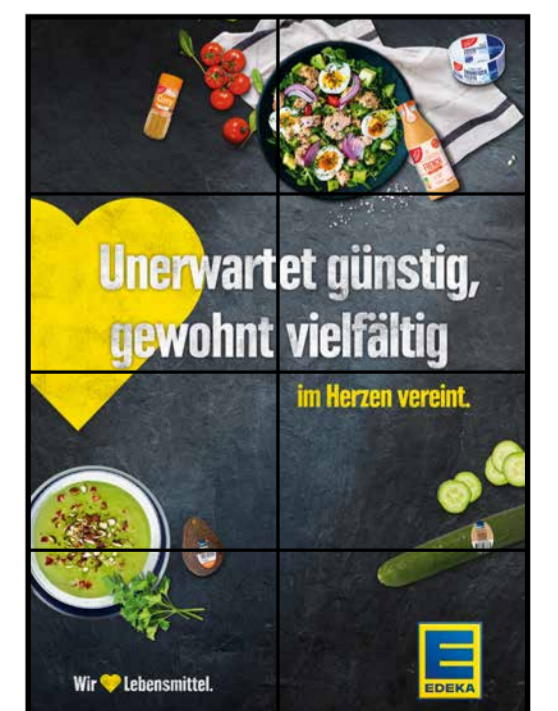
E15 | Eingang | wall-2x4 | A3