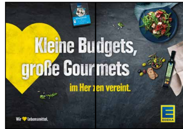
K2 | Kassentisch | wall-2x1 | A2