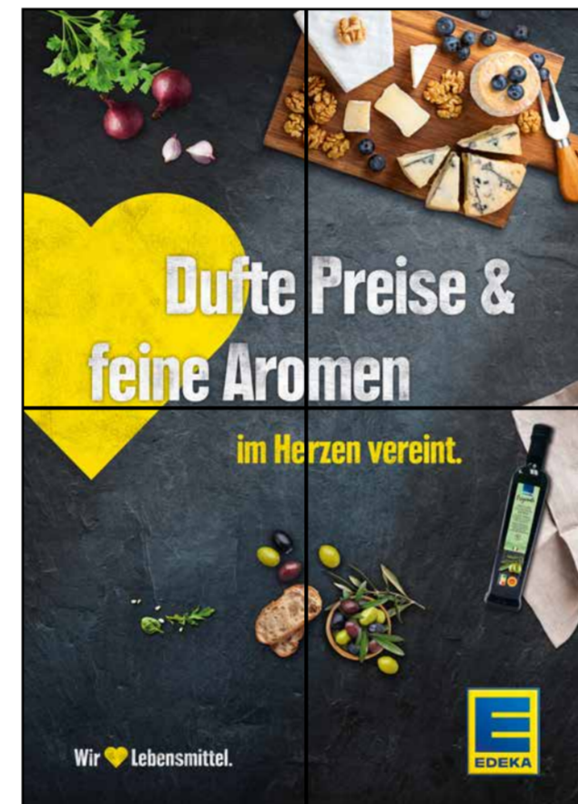
F2 | Frischetheke | wall-2x2 | A2/A3