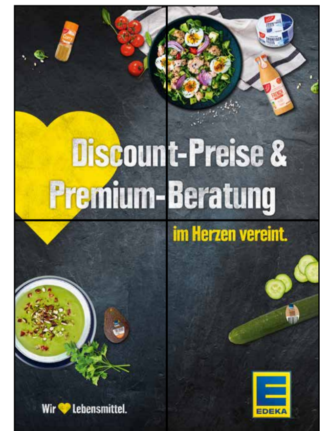
F8 | Frischetheke | wall-2x2 | A2/A3