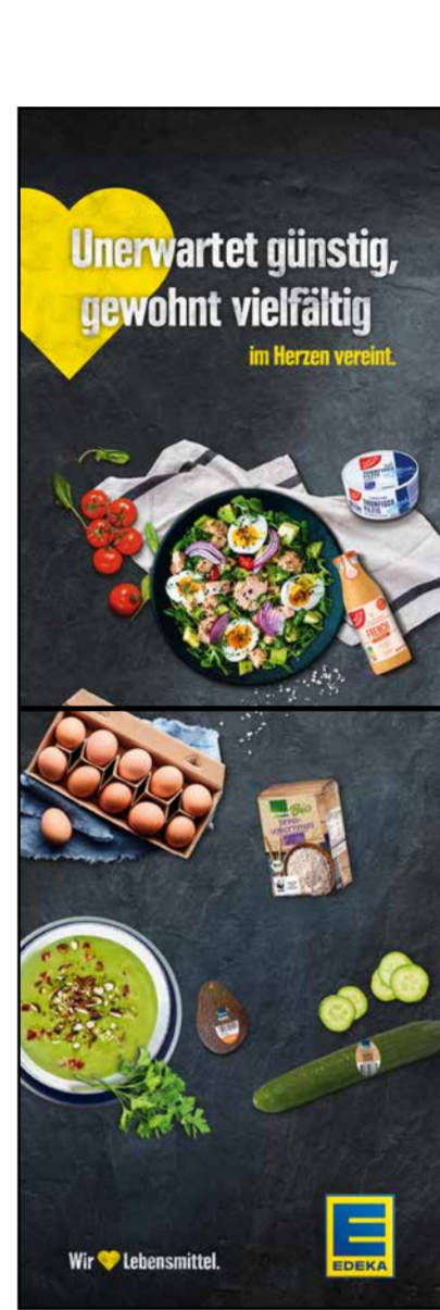
S8 | Stele-1x2 | A2