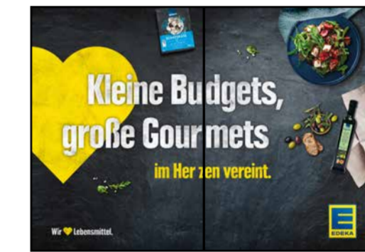
B2 | BakeOff | wall-2x1 | A3