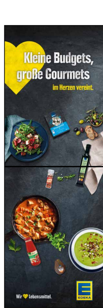
S7 | Stele-1x2 | A2