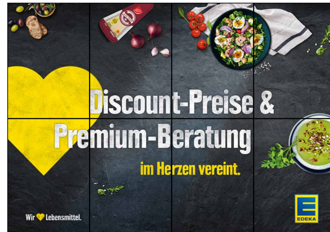
F7 | Frischetheke | wall-4x2 | A2/A3