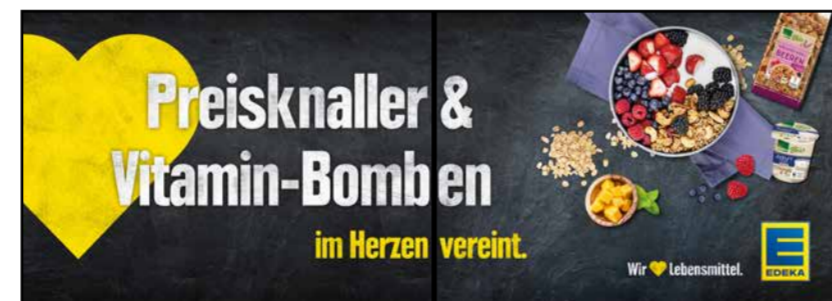
OG7 | Obst & Gemüse | wall-2x1 A3 quer