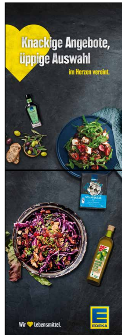
S13 | Stele-1x2 | A2