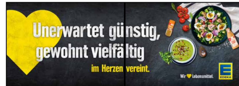
OG5 | Obst & Gemüse | wall-2x1 A3 quer