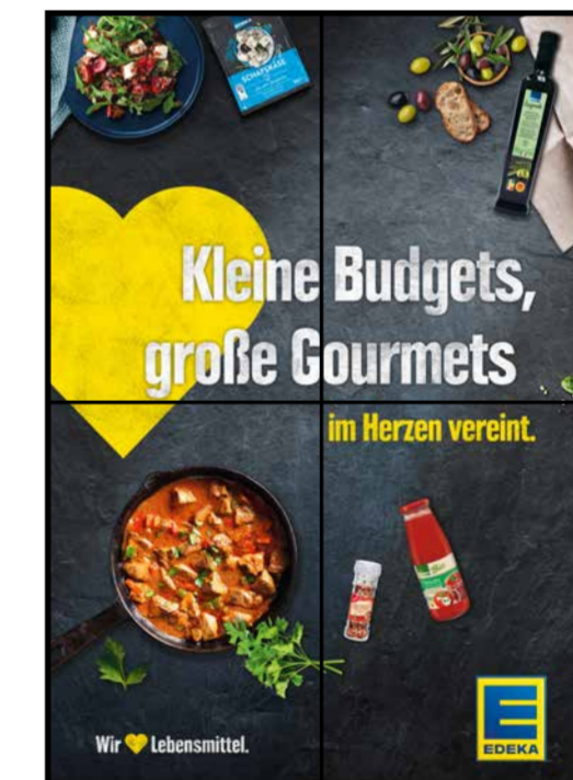
E11 | Eingang | wall-2x2 | A2