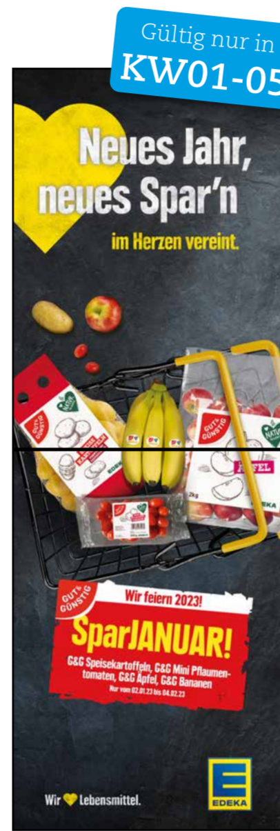
S6 | Stele-1x2 | A2