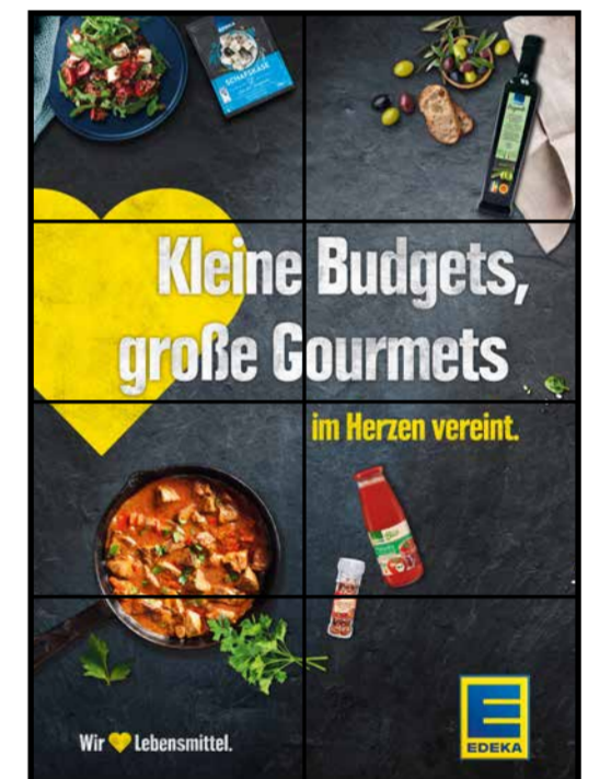
E14 | Eingang | wall-2x4 | A3