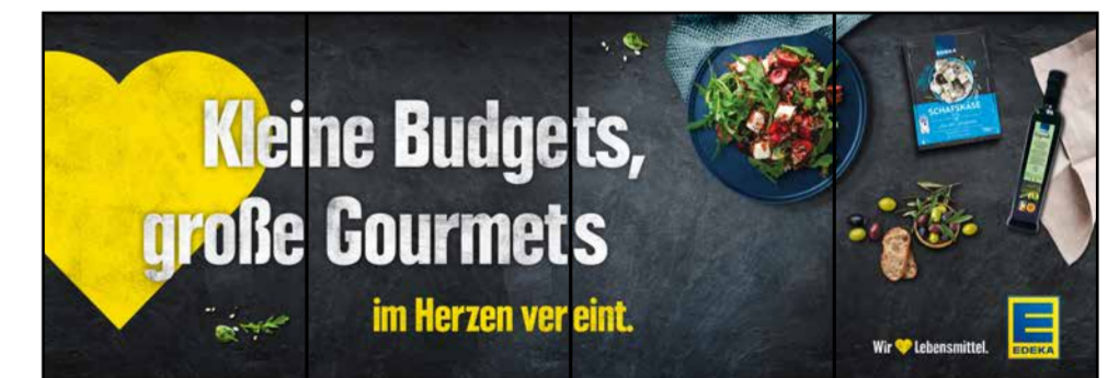
B8 | BakeOff | wall-4x1 | A3