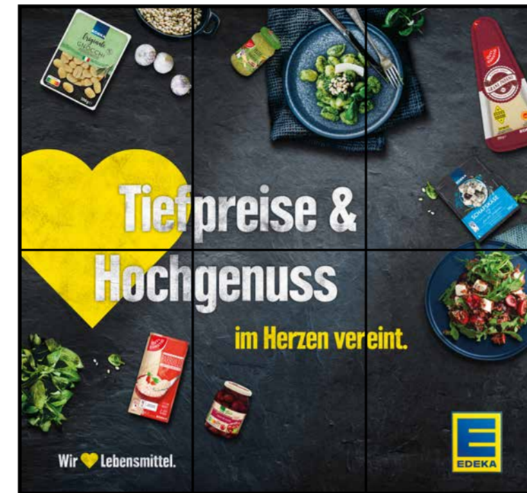
E4 | Eingang | wall-3x2 | A2