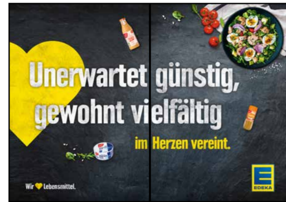
K3 | Kassentisch | wall-2x2 | A3