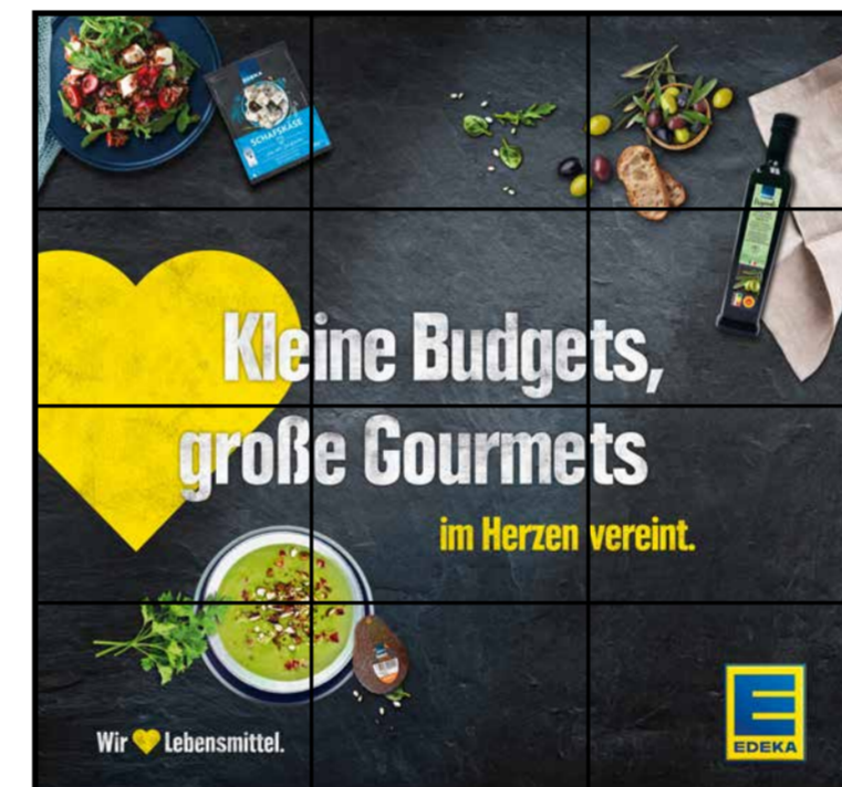
E8 | Eingang | wall-3x4 | A3