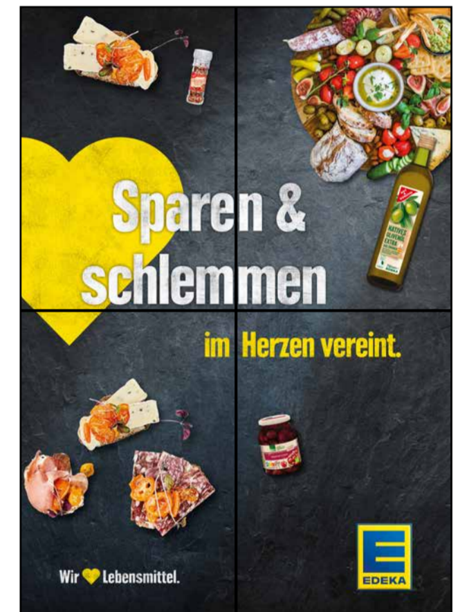
F6 | Frischetheke | wall-2x2 | A2/A3