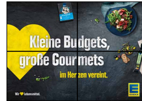
K5 | Kassentisch | wall-2x2 | A3