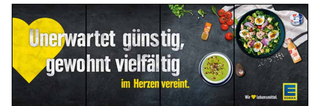
B9 | BakeOff | wall-4x1 | A3