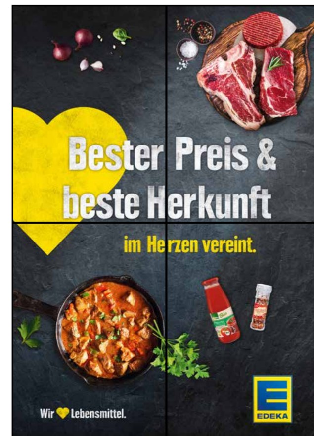
F4 | Frischetheke | wall-2x2 | A2/A3