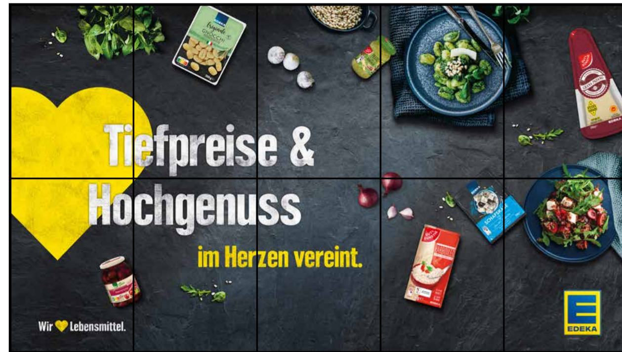
E1 | Eingang | wall-5x2 | A2/A3