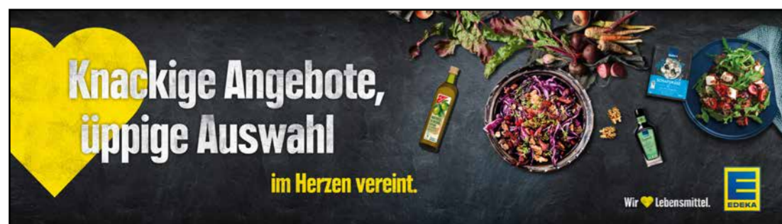
OG4 | Obst & Gemüse | wall-Sonderformat