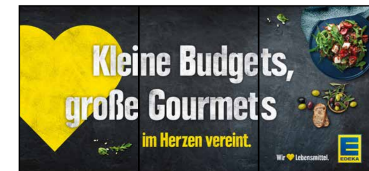
B5 | BakeOff | wall-4x1 | A3