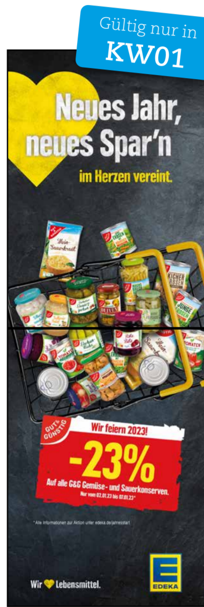
S2 | Stele-1x2 | A2