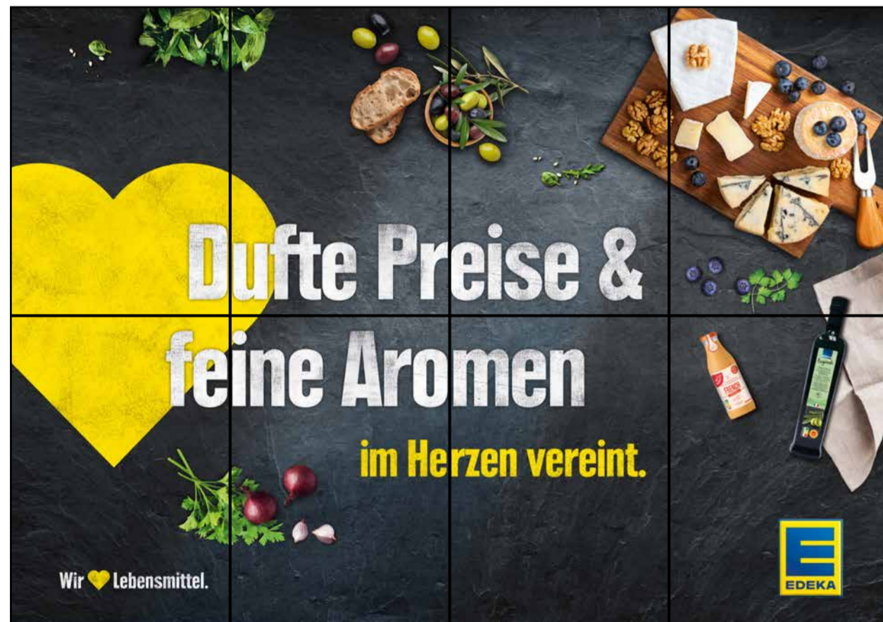
F1 | Frischetheke | wall-4x2 | A2/A3