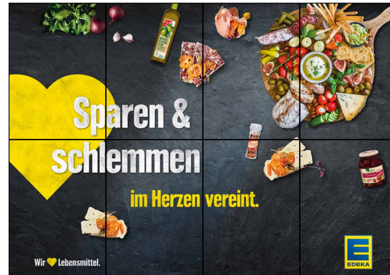
F5 | Frischetheke | wall-4x2 | A2/A3