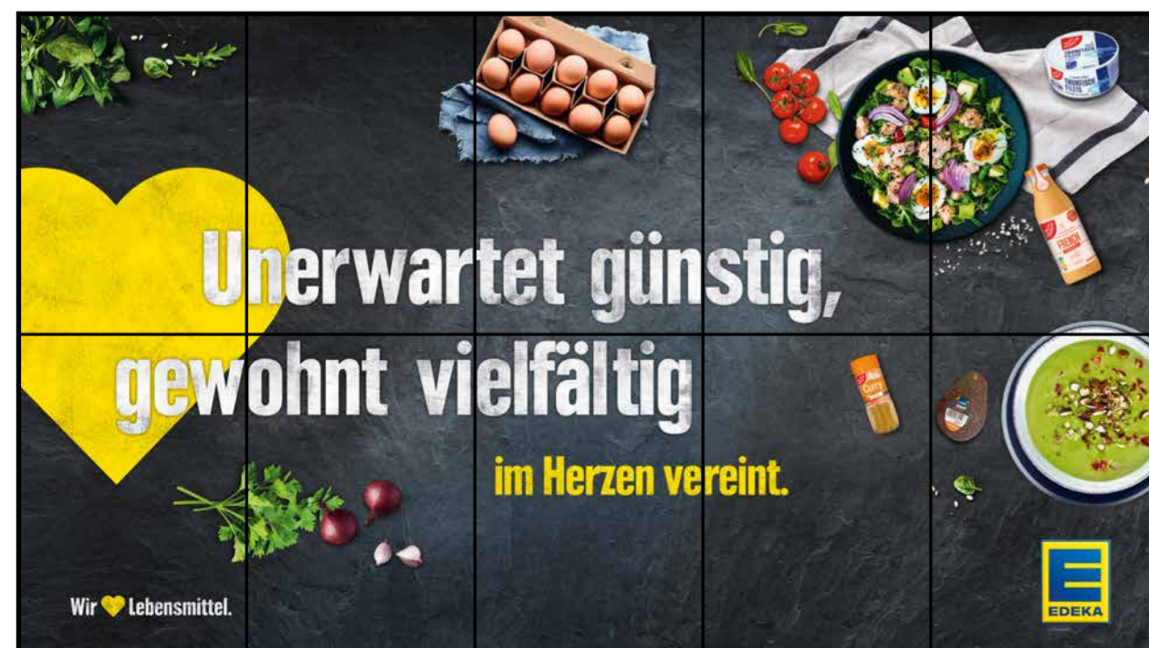
E3 | Eingang | wall-5x2 | A2/A3