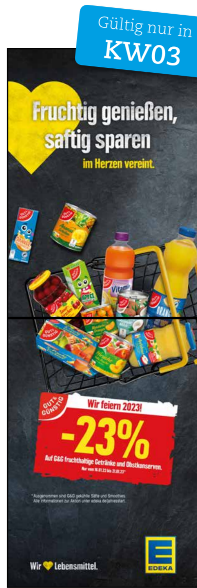
S4 | Stele-1x2 | A2