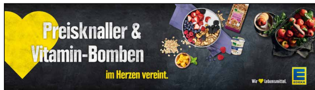
OG3 | Obst & Gemüse | wall-Sonderformat