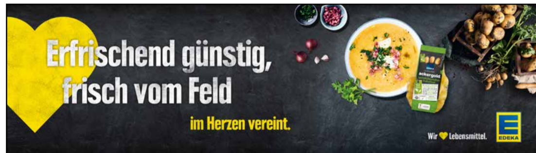
OG2 | Obst & Gemüse | wall-Sonderformat