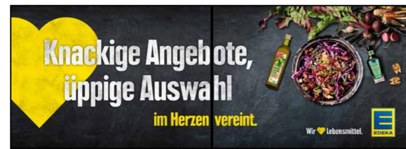
OG8 | Obst & Gemüse | wall-2x1 A3 quer