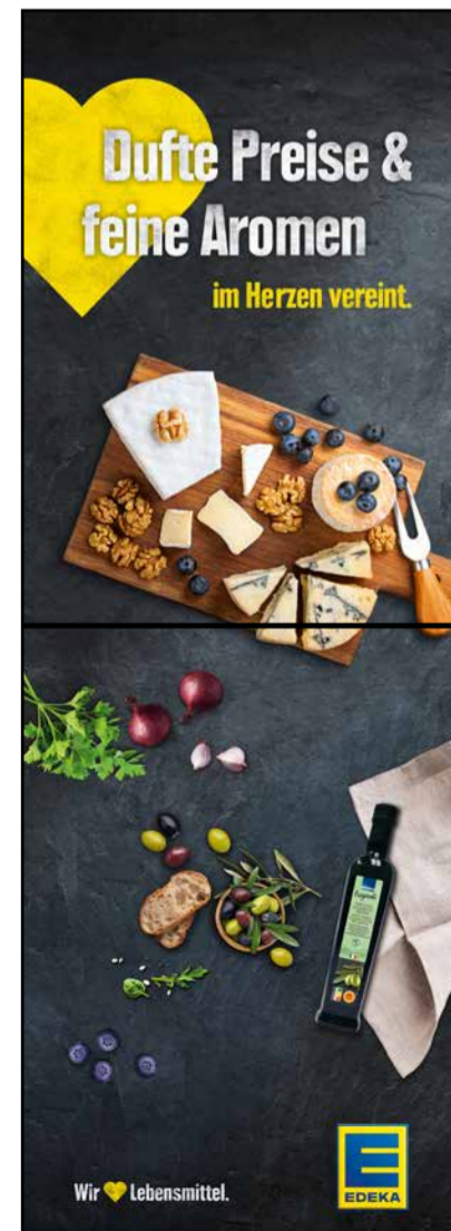
S9 | Stele-1x2 | A2