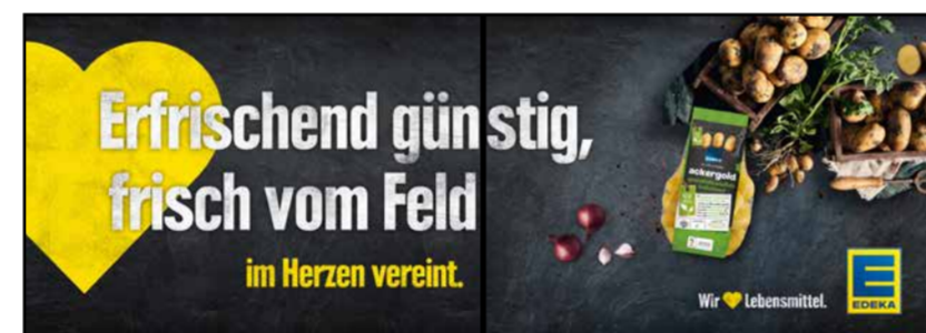
OG6 | Obst & Gemüse | wall-2x1 A3 quer