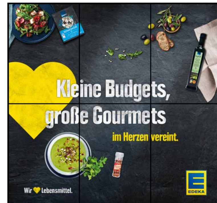
E5 | Eingang | wall-3x2 | A2