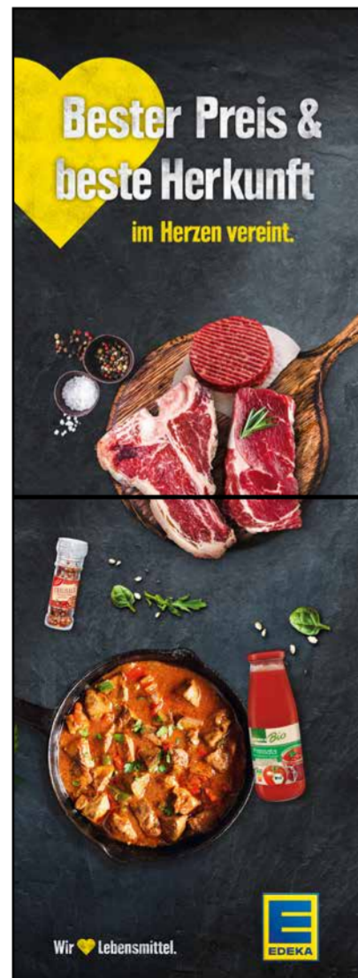
S10 | Stele-1x2 | A2