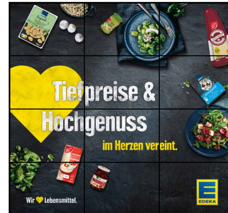
E7 | Eingang | wall-3x4 | A3