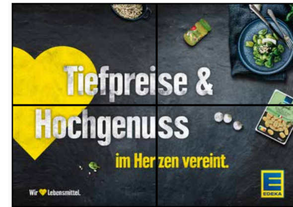
K4 | Kassentisch | wall-2x2 | A3