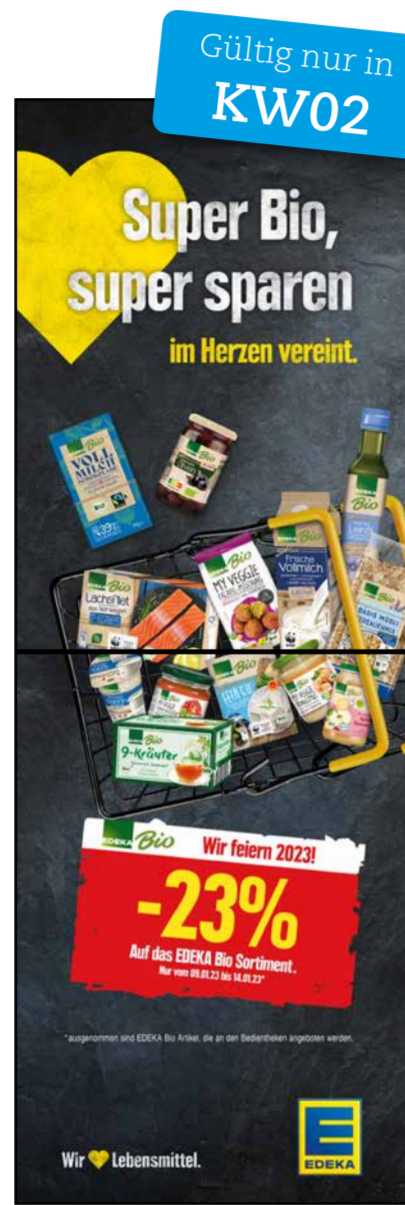
S3 | Stele-1x2 | A2