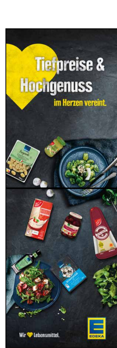
S1 | Stele-1x2 | A2