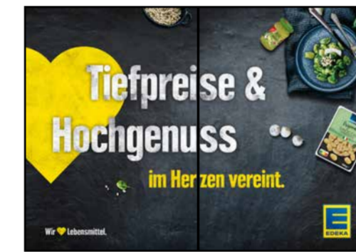
B1 | BakeOff | wall-2x1 | A3