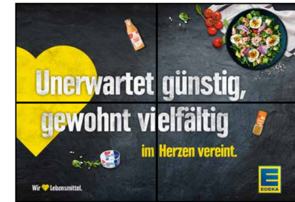
K6 | Kassentisch | wall-2x2 | A3