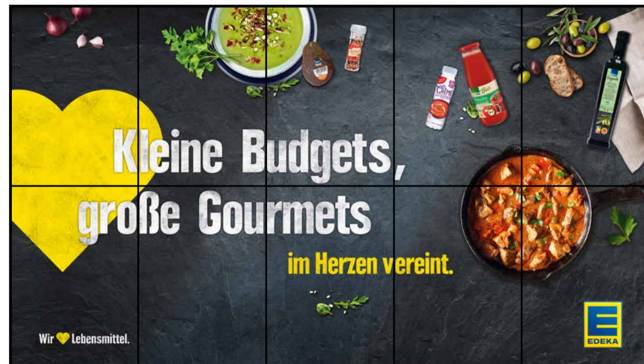
E2 | Eingang | wall-5x2 | A2/A3