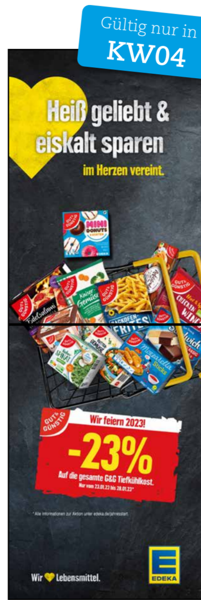
S5 | Stele-1x2 | A2