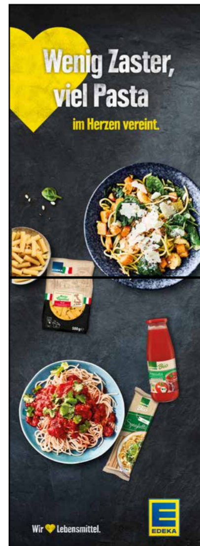
S14 | Stele-1x2 | A2