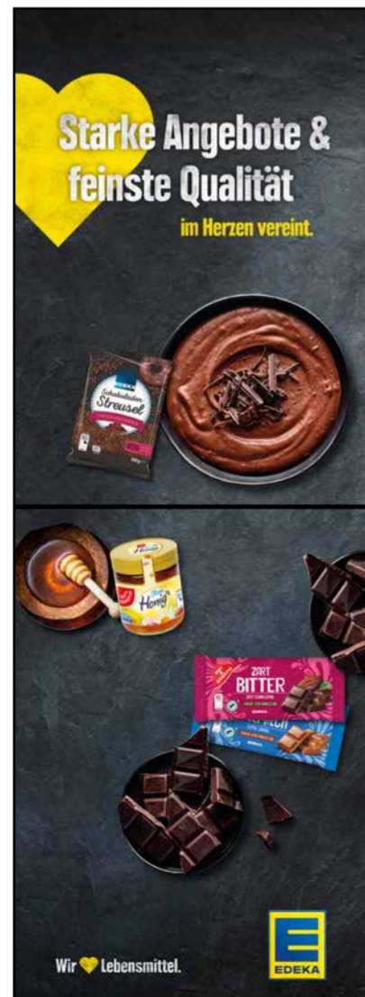
S11 | Stele-1x2 | A2