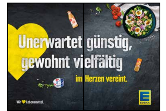
B3 | BakeOff | wall-2x1 | A3