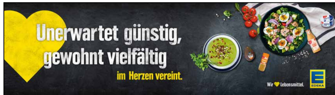
OG1 | Obst & Gemüse | wall-Sonderformat